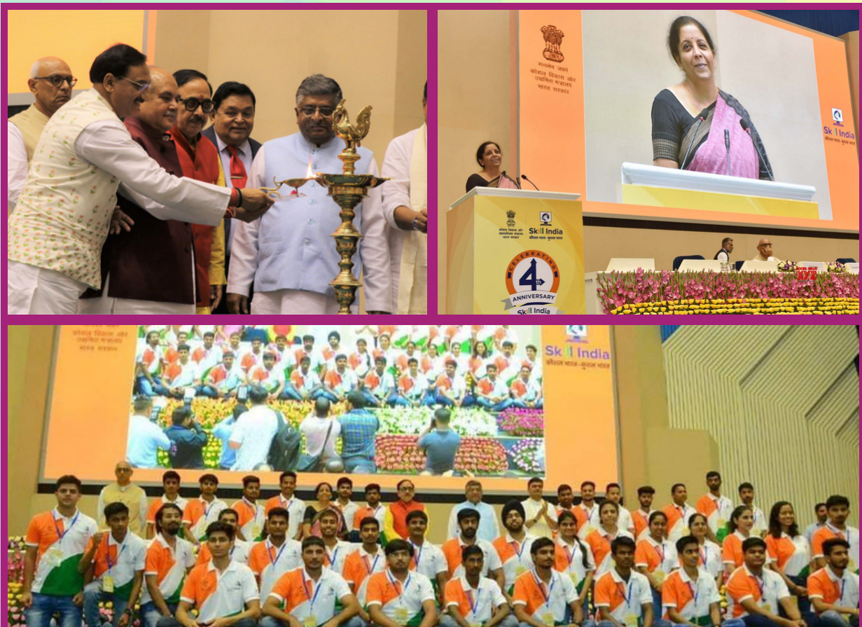
Glimpses of Skill India 4th anniversary celebration

On this occasion, MSDE announced launch of Kaushal Pakhwada, a 15-day campaign from July 16, under which sessions and workshops will be conducted across the country to aspire young trainees under the Skill India Mission. The event also witnessed introduction of 48-member contingent that will be representing India at World Skills International Competition, to be held from August 22 – 28 in Kazan, Russia. These young skill trainees, below 23 years, will be competing in 44-skills against their peers from 66 other countries. CSDCI is participating in 4 skill trades at Kazan, Russia. Team CSDCI wishes them all the very best for their competition ahead.