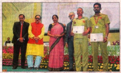
प्रधानमंत्री के द्वारा विश्व युवा कौशल दिवस के अवसर पर एक समारोह का आयोजन किया गया।

आज का न्यू इंडिया बनने, अवसरों और एक मजबूत विकास का भारत है। आज का युवा एक उज्ज्वल भविष्य की उम्मीद करता है। वह उम्मीद कर रहा है एक एकदम की नया से चुनौतियों के साथ एक ऐसे इकोनॉमिक की, जो उसके लिए बेहतरीन अवसरों के अवसर सजाए। कौशल विकास और उद्यमिता के माध्यम से देश के युवाओं को कामकाज करने की दिशा में सहायता कर रहा है। विश्व युवा कौशल दिवस के अवसर पर वर्ष 15 जुलाई 2019 को प्रधानमंत्री श्री नरेंद्र मोदी के द्वारा संचालित विश्व युवा कौशल दिवस के माध्यम से कौशल विकास के माध्यम से देश के युवाओं को कामकाज करने की दिशा में सहायता कर रहा है। आज 27 जून को ही भारत विश्व का सबसे बड़ा देश बन चुका है। भारत 29 वर्ष की आयु के युवाओं के साथ, बृहत् आर्थिक विकास का युवा से संचालित विकास के माध्यम से कौशल विकास के माध्यम से देश के युवाओं को कामकाज करने की दिशा में सहायता कर रहा है। आज 27 जून को ही भारत विश्व का सबसे बड़ा देश बन चुका है। भारत 29 वर्ष की आयु के युवाओं के साथ, बृहत् आर्थिक विकास का युवा से संचालित विकास के माध्यम से देश के युवाओं को कामकाज करने की दिशा में सहायता कर रहा है।